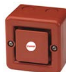
Option: boîtier sans brides de fixation